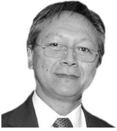
Clemente Poon Hung SECRETARÍA DE COMUNICACIONES Y TRANSPORTES México